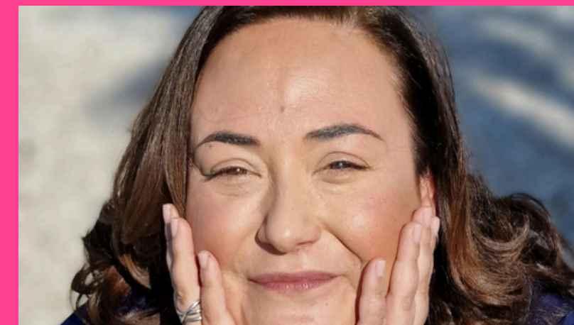
Victoria y los libros